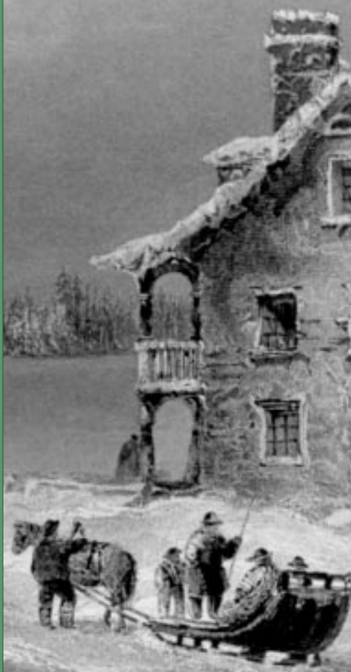
Couverture : basée sur View of Symmes' Inn from Main Street, 1842, par W.H. Bardet, artiste.

Le circuit patrimonial Outaouais-Pontiac nous emmène visiter des colonies de peuplement et des sites historiques du côté québécois de la rivière Outaouais entre Aylmer et Fort Coulonge.